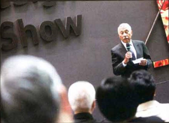
著名設計師HENRY STEINER與現場人士分享設計心得。

理大設計年展可謂香港大型設計盛事之一，不但展出一眾設計學院學生的創意作品，亦為業界和社會大眾提供一個交流和吸收創意的平台。今屆年展正於九龍塘創新中心底層展出，包括數碼媒體 (DIGITAL MEDIA)、多媒體設計與科技 (MULTIMEDIA DESIGN & TECHNOLOGY) 及產品創新科技 (PRODUCT INNOVATION TECHNOLOGIES) 等專業的學生作品一百八十多項，範疇包括廣告設計 (ADVERTISING)、數碼媒體 (DIGITAL MEDIA)、環境與室內設計 (ENVIRONMENT & INTERIOR DESIGN)、工業及產品設計 (INDUSTRIAL & PRODUCT DESIGN) 和視覺傳達 (VISUAL COMMUNICATION)。展覽根據動畫和產品設計等不同主題劃分為不同展區，展出一眾畢業學生的作品，在場學生亦落力為觀眾解說創作理念，不論是從事創意行業、還是一般社會大眾而言，這個設計年展都值得去。